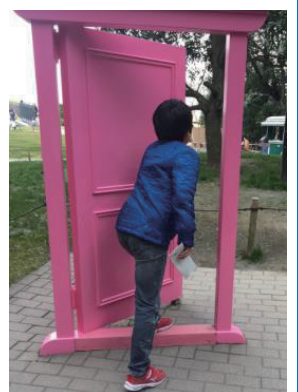
ドラえもん美術館にて

コロナ禍前に日常生活が戻りつつあります。行きたい場所に行く、会いたい人に会いに行くことをずっと我慢していました。「どこでもドア」ですぐにどこへでも行くことはできないけれど、思い立ったら吉日、思い出作りに出かけよう！ (事務局KH)